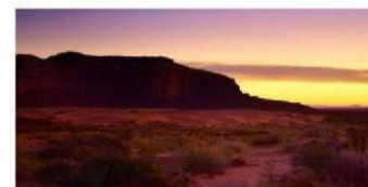
Hébergement Comme Suit